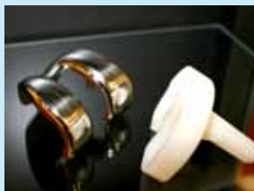
Bild ovan: Knäleds-implantat.

Du får fortsätta med dropp tills du är tillräckligt vaken och orkar äta och dricka. Du får regelbunden smärtlindring och återigen vill vi betona vikten av att du säger till om du har ont eller om det är något som inte känns bra. Du kommer att få skatta din smärta på en sk VAS skala som är graderad från 0-10. Detta för att vi tillsammans lättare ska kunna se hur din smärta förändras.