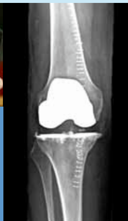
Bild till höger: Efter en knäplastikoperation. Metalldelen i den nya leden syns tydligt i vitt.